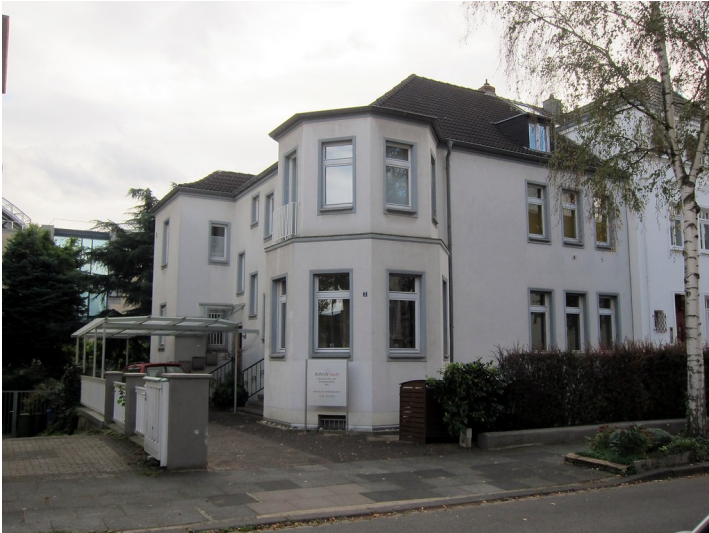
Das Wohnhaus Coburger Straße 3 in Bonn (2014).