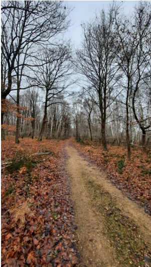
ehemalige Panzerstraße unweit Drove (2025)