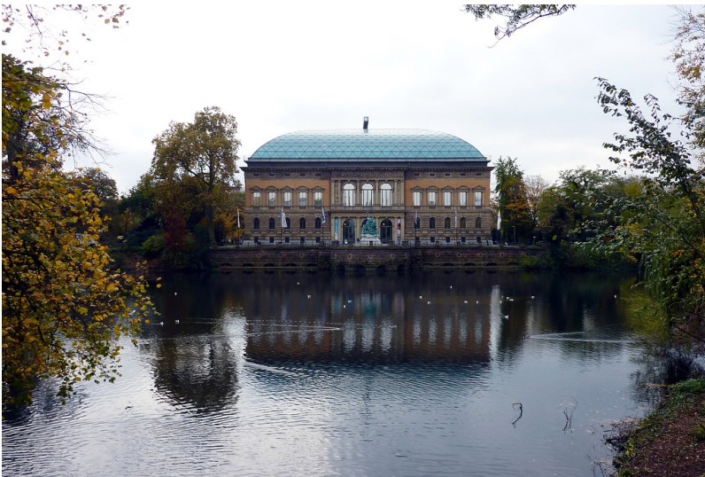
Ständehaus in Düsseldorf mit Kaiserteich (2014)