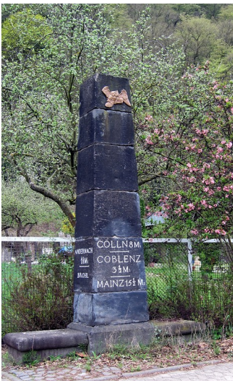
Preußischer Meilenstein an der alten B 9 in Brohl