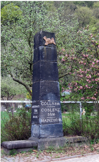
Preußischer Meilenstein an der alten B 9 in Brohl