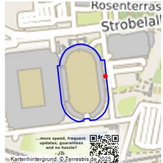
Das Stadion "Kampfbahn Rote Erde" vor dem heutigen Signal-Iduna-Park, dem ehemaligen Westfalenstadion in Dortmund (2011).

Das im Westfalenpark im Süden Dortmunds liegende Stadion „Kampfbahn Rote Erde“ ist ein Fußball- und Leichtathletikstadion. In erster Linie wird es mit dem Fußballverein Borussia Dortmund in Verbindung gebracht, der zwischen 1937-1974 seine Heimspiele in diesem Stadion bestritt.