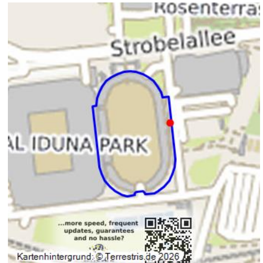
Das Stadion "Kampfbahn Rote Erde" vor dem heutigen Signal-Iduna-Park, dem ehemaligen Westfalenstadion in Dortmund (2011).

Das im Westfalenpark im Süden Dortmunds liegende Stadion „Kampfbahn Rote Erde“ ist ein Fußball- und Leichtathletikstadion. In erster Linie wird es mit dem Fußballverein Borussia Dortmund in Verbindung gebracht, der zwischen 1937-1974 seine Heimspiele in diesem Stadion bestritt.