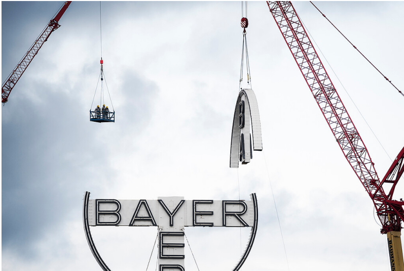
Die Demontage des Bayer-Kreuzes vom Dach des Werks in Krefeld-Uerdingen mithilfe von großen Kränen (19. November 2016).