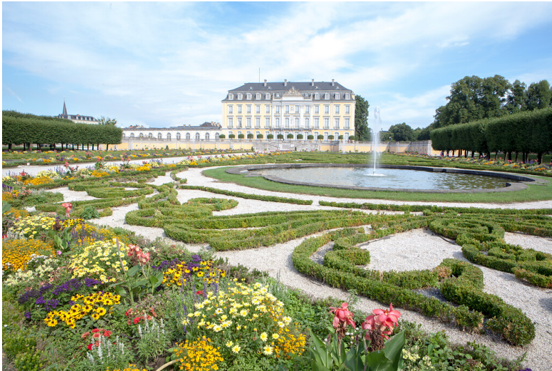
Schloss Augustusburg in Brühl mit dem Schlosspark im Vordergrund (2015)