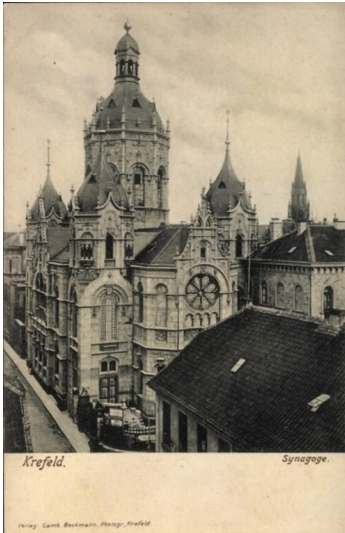
Historische Postkarte (1900-1905) der Synagoge in Krefeld