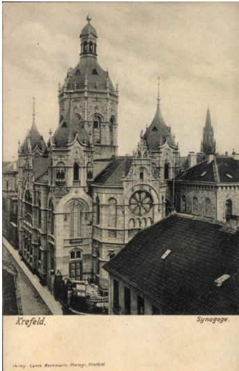
Historische Postkarte (1900-1905) der Synagoge in Krefeld