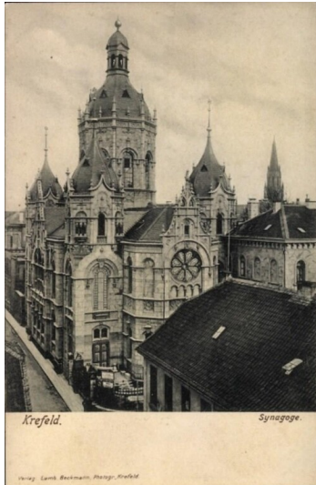
Historische Postkarte (1900-1905) der Synagoge in Krefeld