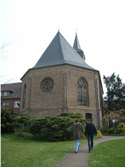
Evangelische Kirche in Sonsbeck (2008)