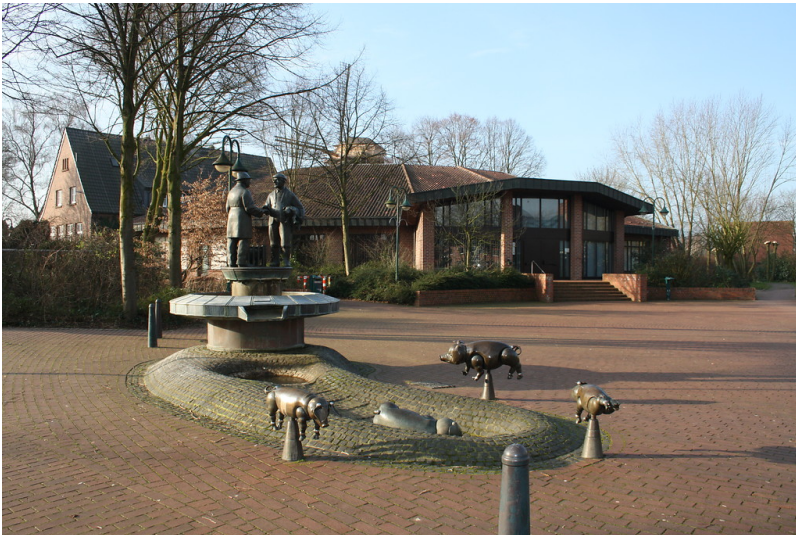
Der Ferkelbrunnen auf dem Rathausvorplatz Sonsbeck mit bronzenen Schweinen, einer Sau mit Ferkeln und zwei Handelspartnern auf der Brunnenplattform (2014)