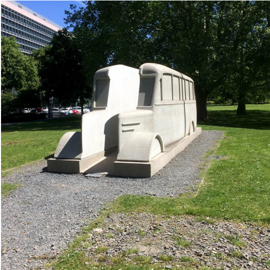
Das "Denkmal der grauen Busse" am LVR-Landeshaus in Köln-Deutz (2019).