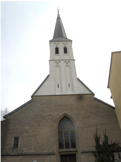
Wallfahrtskapelle St. Gerebernus in Sonsbeck mit weißem Turm über dem Sansteingebäude von der Portalseite aus gesehen (2008)