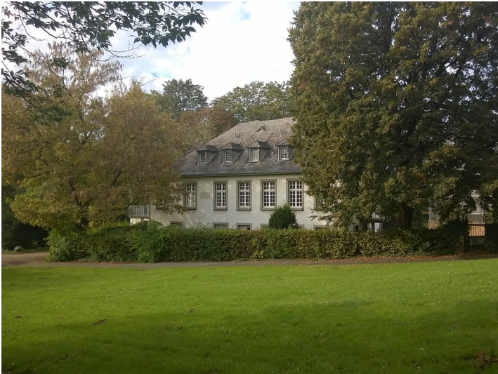
Geburtshaus von Peter Joseph Lenné vom Alten Zoll aus gesehen (2014)