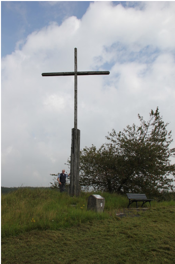
Schümelkreuz am Geisberg in Mannebach (2014)