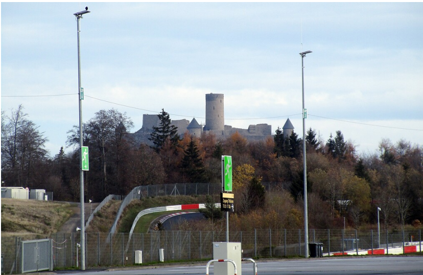
Die für die Rennstrecke namensgebende Nürburg, Ansicht vom Fahrerlager der Grand-Prix-Strecke des Nürburgrings (2020).