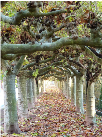
Fußgängerweg zwischen der Platanenallee an der Weseler Straße in Büderich, Wesel (2014).