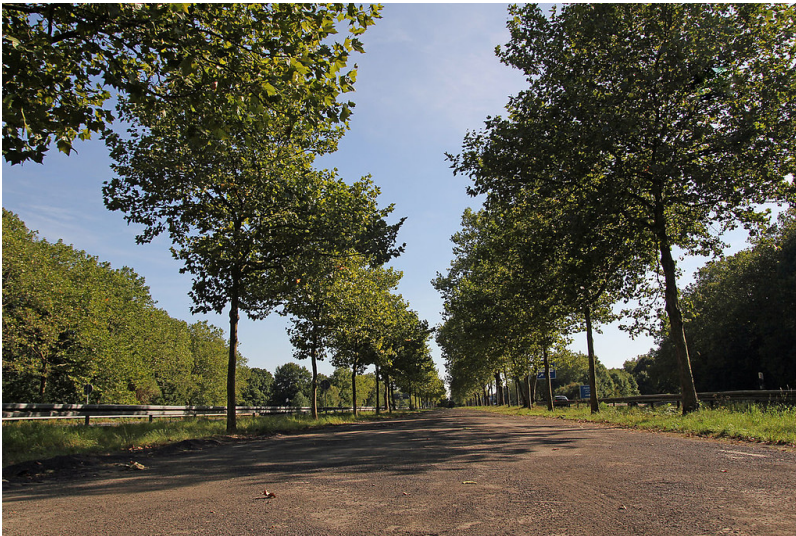
Trasse der Bundesautobahn A 555 („Diplomatenrennbahn“) zwischen Autobahnkreuz Köln-Süd und Verteilerkreis Köln (2012).