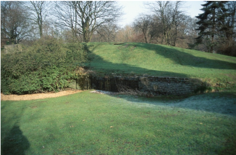
Die Kasematte im Heubergpark von außen. Es handelt sich um einen mit Gras bewachsenen Hügel, an dessen unterem Rand eine Ziegelmauer mit einem vergitterten Bereich zu erkennen ist (2014).