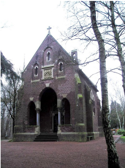
Friedhofskapelle Wassenberg-Birgelen (2003)