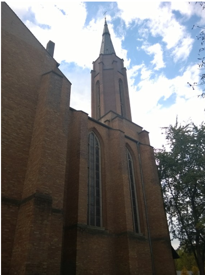
Kreuzkirche mit Turm in Bonn (2014)