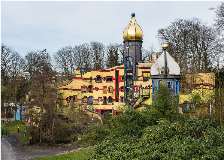
Das "Ronald McDonald-Haus" von Friedensreich Hundertwasser im Essener Grugapark (2016).