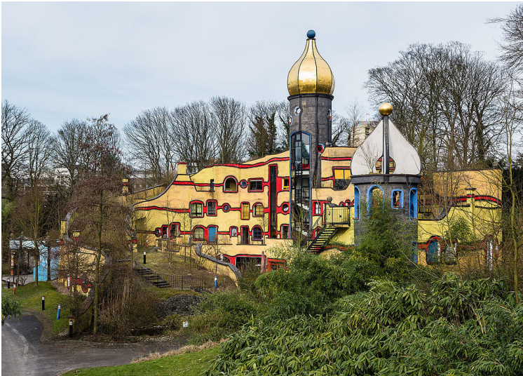
Das "Ronald McDonald-Haus" von Friedensreich Hundertwasser im Essener Grugapark (2016).