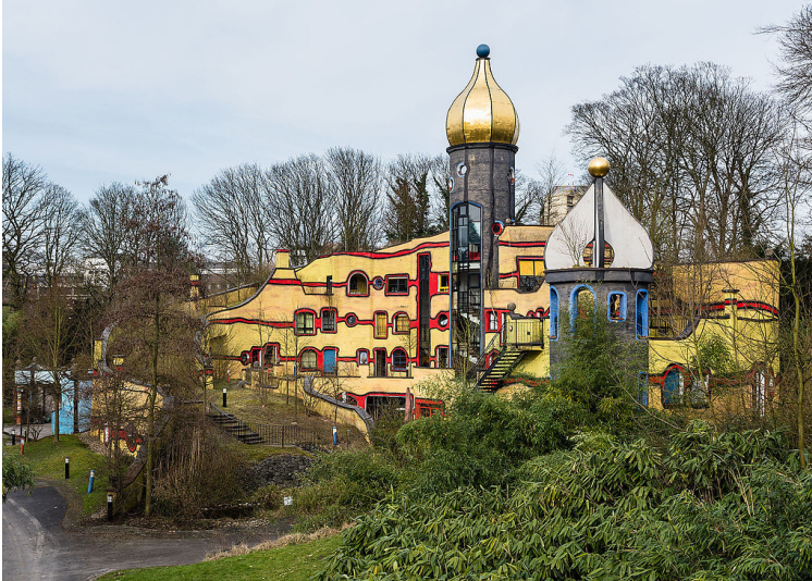
Das "Ronald McDonald-Haus" von Friedensreich Hundertwasser im Essener Grugapark (2016). Fotograf/Urheber: Tuxyso