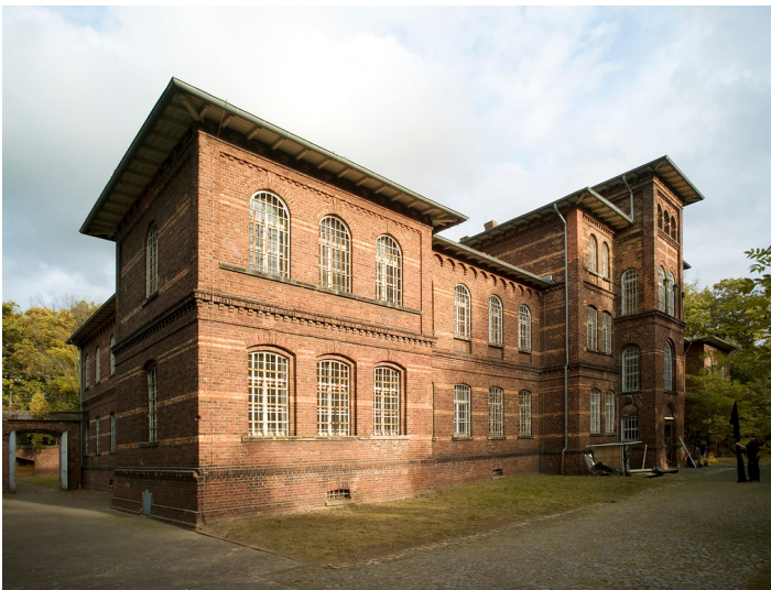
Psychiatriegeschichtliches Dokumentationszentrum Düren (2012)