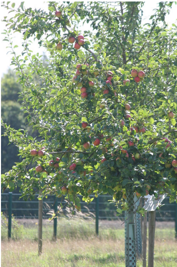
Nahaufnahme einer Apfelbaumkrone mit dicken roten Äpfeln auf der Streuobstwiese des Max-Planck-Instituts für Züchtungsforschung (2014).