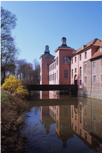
Düsseldorf-Kalkum, Schloss Kalkum mit Schlosspark