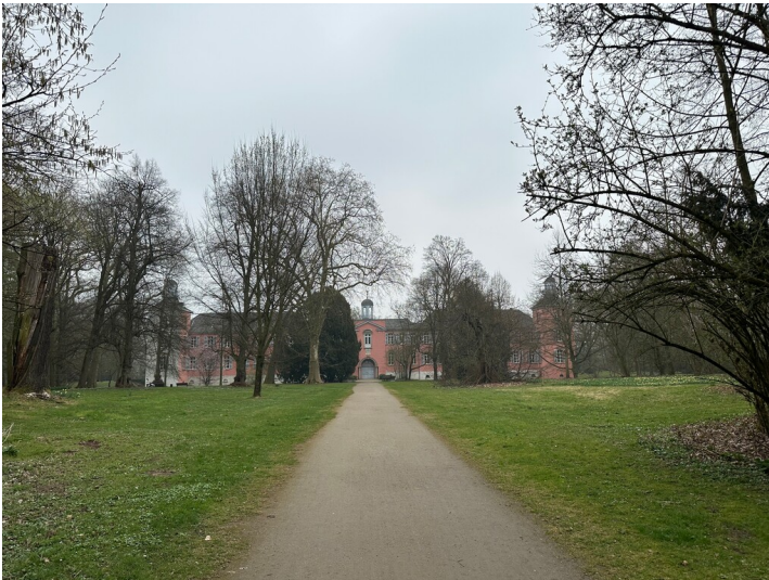
Der Weg zu Schloss Kalkum durch den Schlosspark (2025).