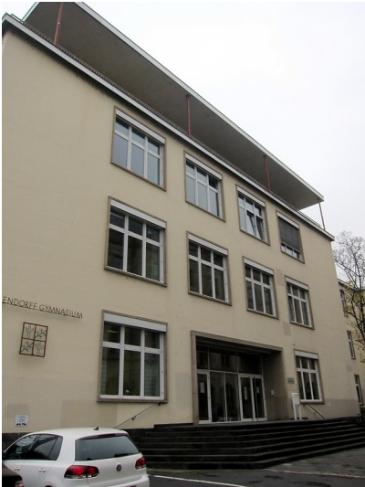
Eingangsbereich des Eichendorff-Gymnasiums in Koblenz (2014)