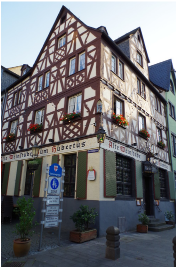
Weinstube Zum Hubertus am Florinsmarkt in der Koblenzer Altstadt (2014)