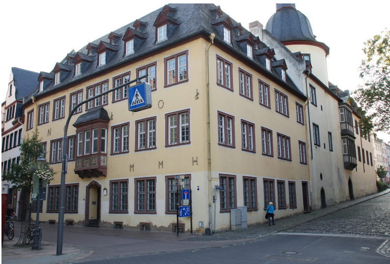
Das Dreikönigenhaus in der Koblenzer Altstadt (2014).