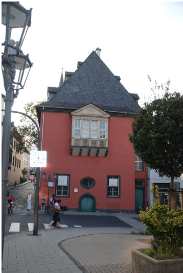
Krämerzunftthaus in der Koblenzer Altstadt (2014)