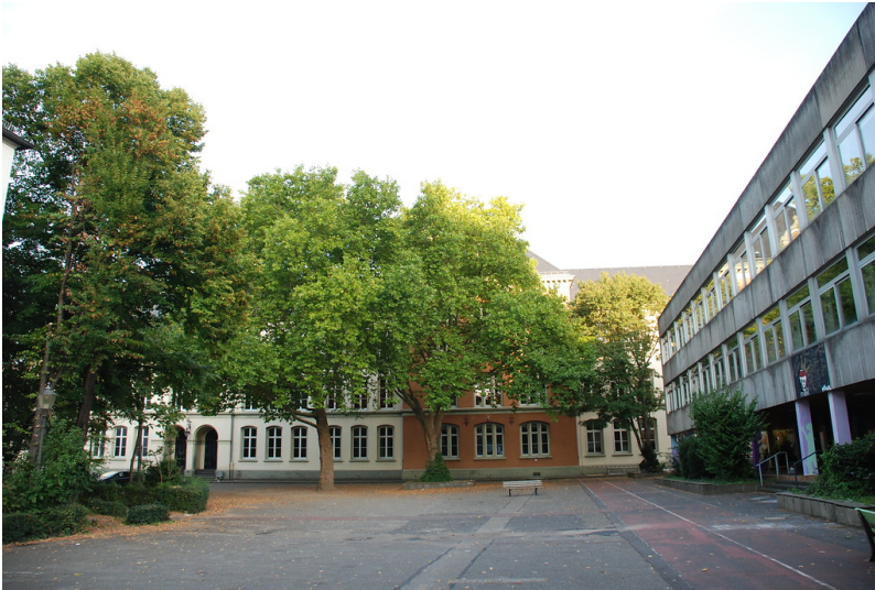
Ältere und neuere Gebäudeteile des Görres-Gymnasiums, dem früheren "Königlich Preußisches Gymnasium" ("Gymnasium Confluentinum") in Koblenz (2014).