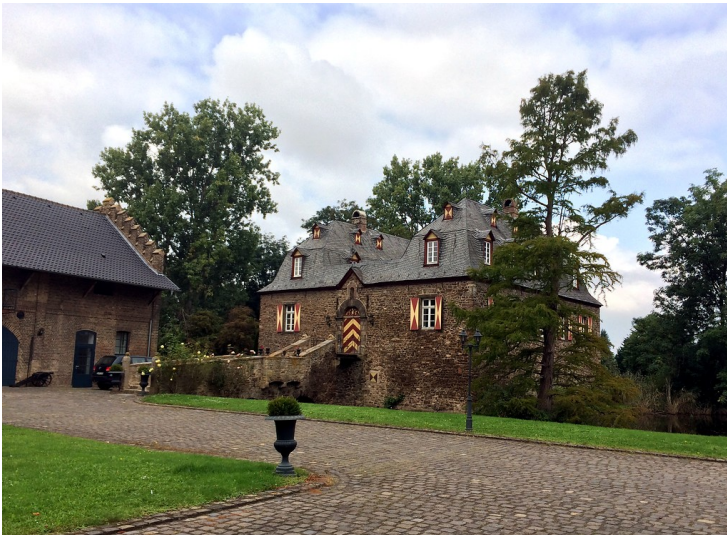
Ein Teil der Kleeburg bei Euskirchen-Weidesheim (2014)