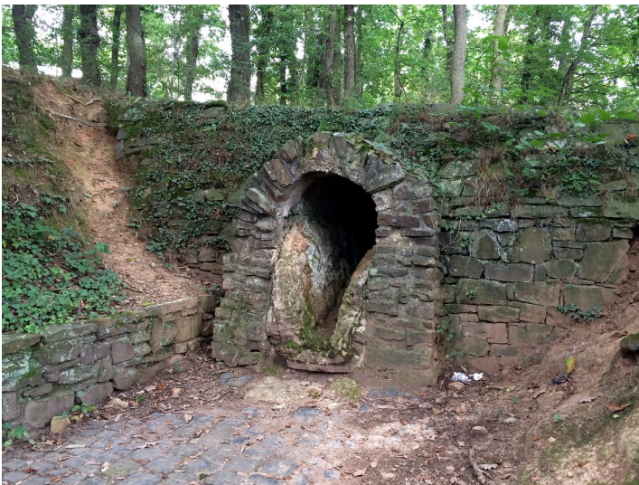
Reste des ehemaligen Römerkanals bei Euskirchen-Kreuzweingarten (2014)