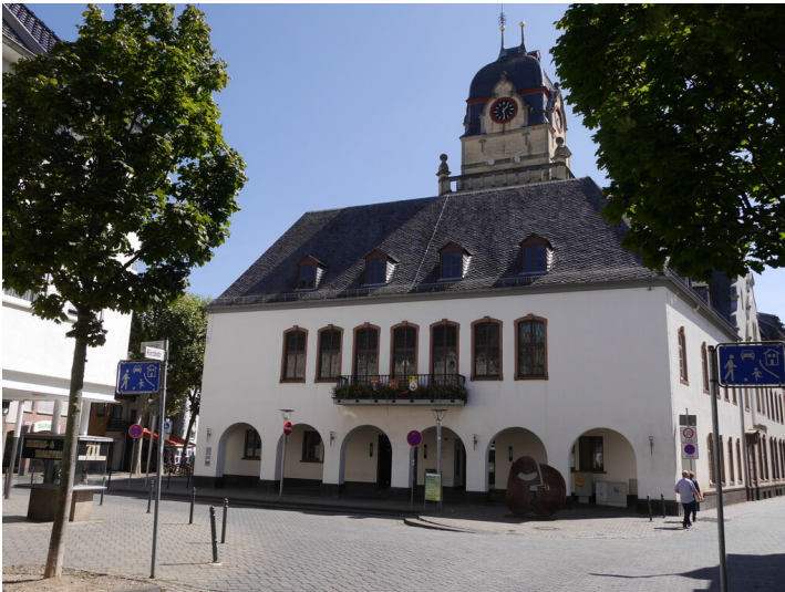
Altes Rathaus in Euskirchen (2024)