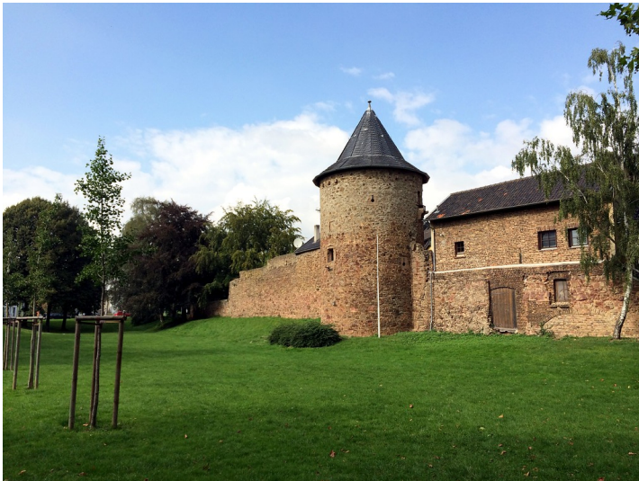
Der Fresenturm in Euskirchen aus südöstlicher Richtung (2014)