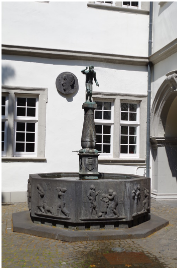
Schängelbrunnen im Koblenzer Rathaushof (2014)