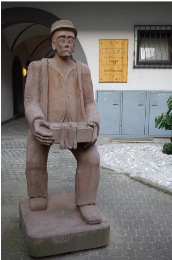
Steinfigur "Der lange Gummi" aus der Serie der Koblenzer Originale in der Gemüse-gasse in der Koblenzer Altstadt (2014) Fotograf/Urheber: Serwas, Anna