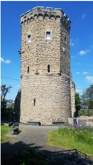
Der renovierte Wolfsturm in Montabaur (2023)