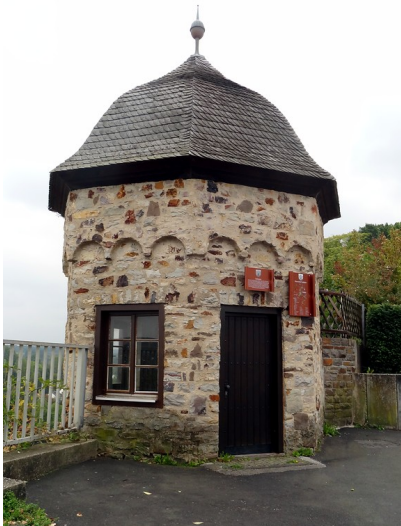
Stadtmauerturm "Schiffchen" der zur ehemaligen Stadtmauer in Montabaur gehört (2014)