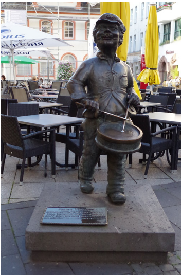
Bronzefigur "Der Resche Hennerich" aus der Serie der Koblenzer Originale auf dem Münzplatz in der Koblenzer Altstadt (2014)