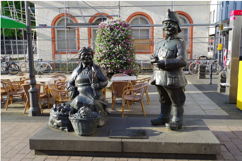
Bronzefiguren "Der Schutzmann Otto" und die "Marktfrau Ringelstein": eines der Kleindenkmäler aus der Reihe der Koblenzer Originale auf dem Münzplatz in der Koblenzer Altstadt (2014).