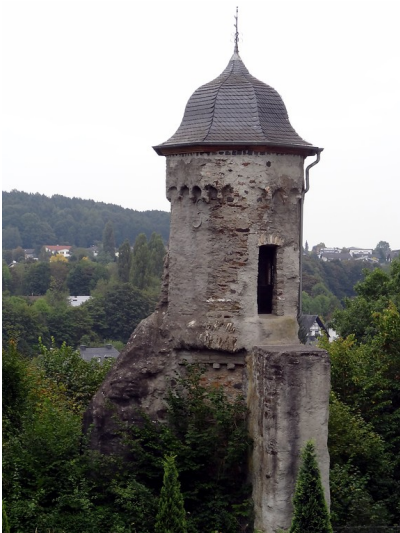
Der "Schwedenturm" der zur ehemaligen Stadtmauer in Montabaur gehört (2014)