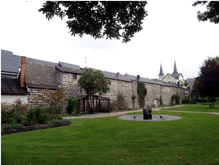
Teil der ehemaligen Stadtmauer von Montabaur. Vor der Mauer befindet sich eine kleine Parkanlage mit Brunnen (2014)