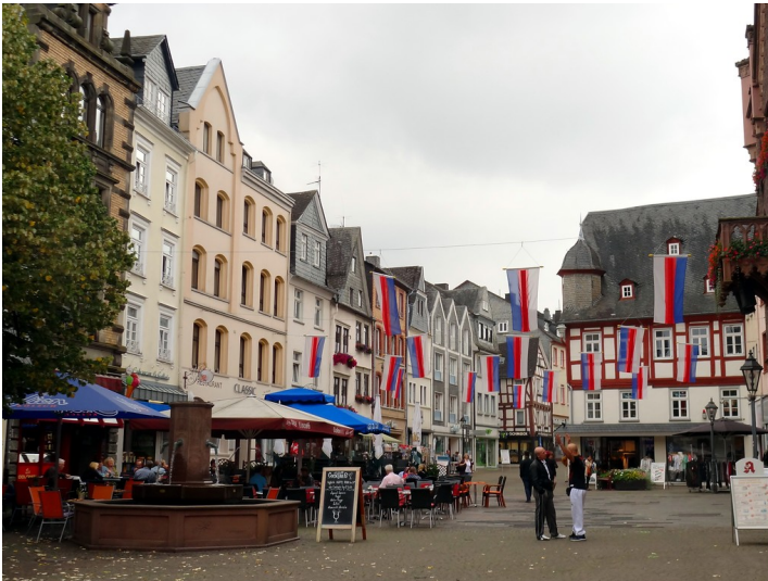
Großer Markt in Montabaur (2014)