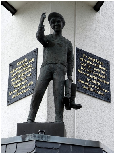
Figur des Schusterjungen am Konrad-Adenauer-Platz in Montabaur (2014)