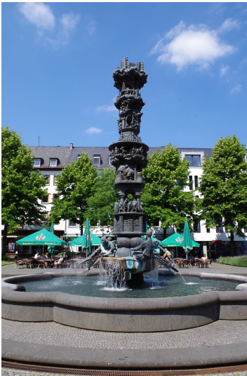
Brunnen mit der Historiensäule auf dem Görresplatz in der Koblenzer Altstadt (2014)