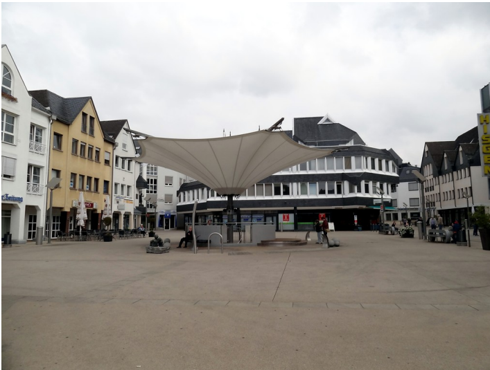
Konrad-Adenauer-Platz in Montabaur (2014)